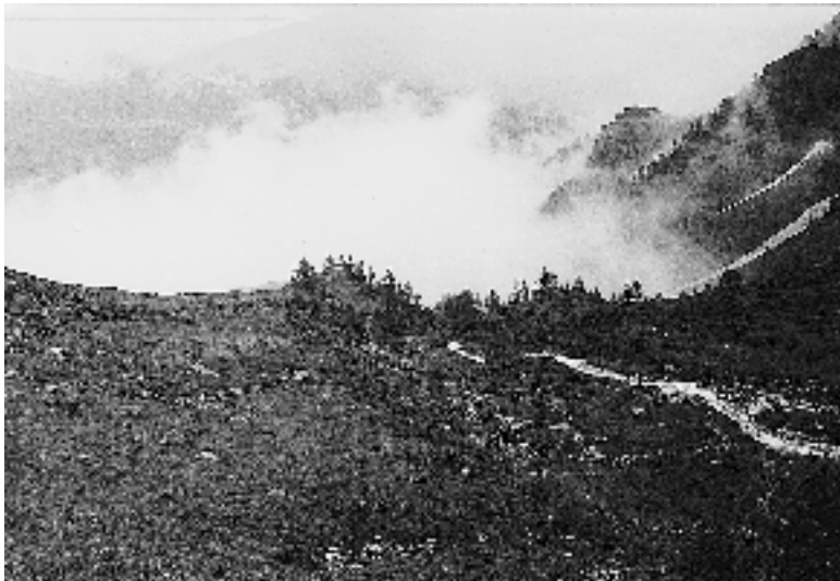
Aufstieg zur Cristallina- Hütte

So könnte es sein. Ob es so auch immer richtig wäre, ist eine andere Frage. Seit ich an dieser Schule bin, sind solche Fahrten eher die Ausnahme. Nicht jedes Jahr steht jemand zur fachlichen Vorbereitung und Begleitung zur Verfügung, nicht immer paßt eine solche Fahrt zeitlich oder inhalt-