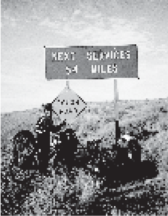
Im dünnbesiedelten Südwesten

wäre, wenn sie eine Nacht in Polizeigewahrsam verbracht hätten.