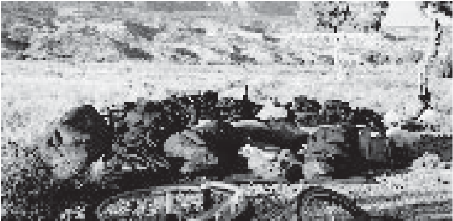
6. November, San Francisco, Kalifornien

Die Wolken haben sich weiter verdichtet, der Wind bläst weiterhin von Südwest. Regen ist zu erwarten, und wir wollen deshalb nicht noch eine weitere Nacht zelten. Die ersten 15 Kilometer sind sehr anstrengend. Die Radwegschilder weisen uns einen Zickzackkurs. Wir beschließen, die weiteren 25 Kilometer bis Santa Cruz