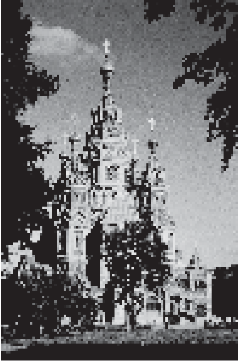
Peter-Paul-Kathedrale (links) Die Schifffahrtsbrücken werden hochgezogen (unten)

Nächte« sahen wir uns an der Newa an, wie um 2 Uhr die Brücken für die Schifffahrt hochgezogen werden. Da keine Untergrundbahnen mehr führen, liefen wir anschließend zu Fuß acht Kilometer bis in den frühen Morgen hinein nach Hause.