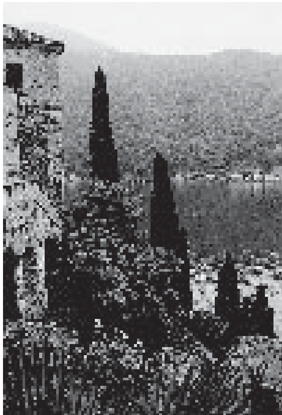
Am Luganer See (Marcote)