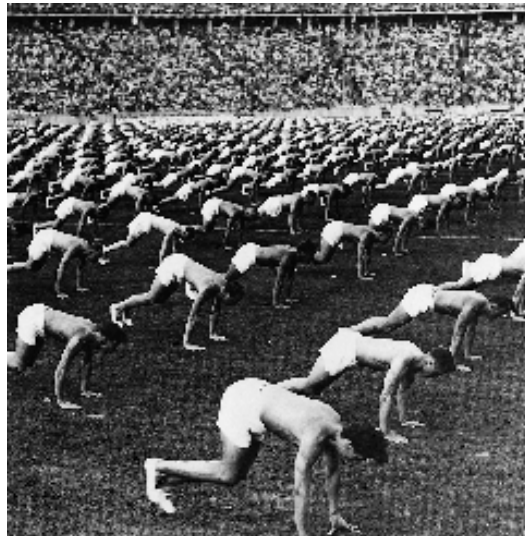
Olympiade 1936: »Flink wie die Windhunde ... hart wie Kruppstahl« – Sport in der Nazizeit

Unabhängig von solchen Berechtigungsfragen im gesamtschulischen Rahmen leidet der heutige Umgang mit diesem Fach am zwiespältigen Verhältnis zum Sport überhaupt. Faszination einerseits und schädliche Auswirkungen auf Gesundheit und Moral andererseits stellen den Lehrer oft vor schwierige Entscheidungen. Kann sich die Schule vor diesen Einflüssen schützen, ohne sich zu verriegeln? Hat sie die Kraft, eigene Werte und Ziele zu entwickeln und negativen Wirkungen des Sports entgegenzusetzen?