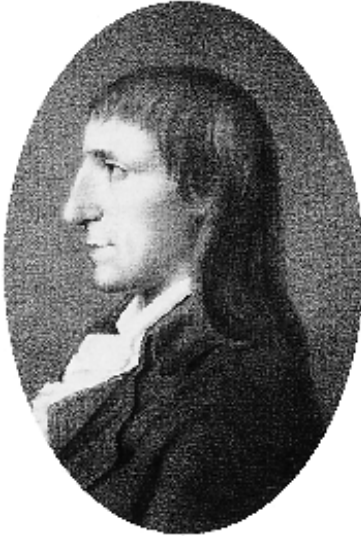
J. C. F. Guts Muths (1759-1839) – Großvater« des Schulturnens

sance (unter anderem Wiedererweckung hellenischer Bildung), im von ihm 1774 gegründeten Philanthropinum die »Schulgymnastik« ein. Die Leibesübungen bekamen mancherorts eine größere Bedeutung. Johann Christoph Guts Muths (1759-1839) gelang es, sie zu einem erzieherischen Ganzen zusammenzufassen (»Gymnastik für die Jugend«, 1793). Doch sie wurde von einem neuen System verdrängt.