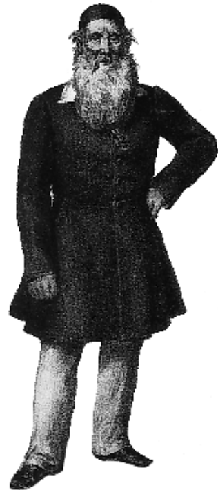
»Turnvater« Jahn (1778-1852) wollte die Jugend körperlich ertüchtigen – auch für die Verteidigung des Vaterlandes

suchte durch Wandern, Spielen und körperliche Ertüchtigung (auf dem ersten Turnplatz) das Volk zu kräftigen. Fechten, Schwimmen, Reiten, Tanzen und für die Wehrtüchtigung taugliche Grundübungen gehörten bald dazu. Neben Jahns Ideen verbreitete sich in Deutschland auch das sog. »Schwedische Turnen« ( Pehr Hendrik Linn , 1776-1839), wobei eine harmonische Körperformung durch Gymnastik angestrebt wurde. Die hierfür entwickelten Turngeräte (z. B. Medizinball und Sprossenwand) gehören heute noch zum allseits bekannten Sporthalleninventar.