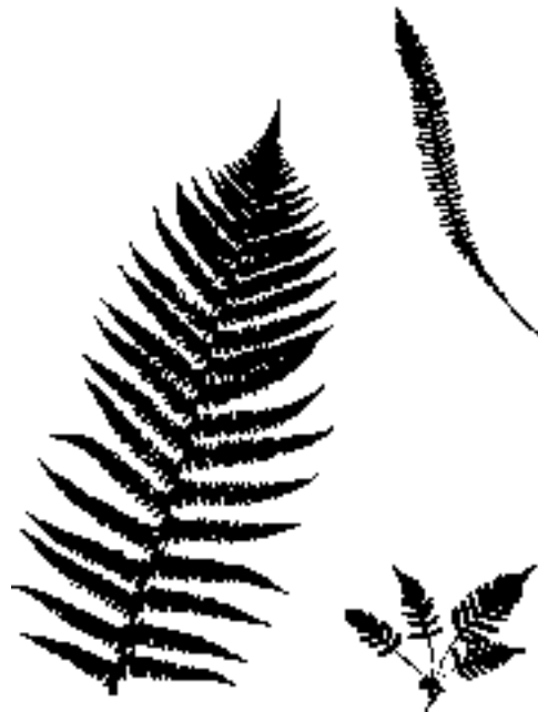
Links der große Wedel vom Wurmfarne, rechts oben ein solcher vom Rippenfarne, darunter der Engelsüßfarne

Das Werden des Farnwedels ist mehr ein kontinuierliches, eine Art fast nicht enden wollendes Addieren. Als Grundelement dienen – dem Baukastensystem vergleichbar – winzig kleine, ausgesprochen rudimentär anmutende Blättlein. Diese werden nun – mit welchem Fleiß! –, fast endlos vervielfältigt, zu einem überaus zierlichen Gebilde angeordnet. Eine Art »Überblatt« liegt damit vor; »Vogelfeder« oder »Fischgerippe« mag man dazu assoziieren. Wie »Schuppen« erscheinen die kleinen Blättchen. Ein jedes kann, je nach Lichteinfall, lamellenartig »verstellt« werden. Zumeist ist eine Annäherung an die horizontale Lage bemerkbar. Blickt man über die Blattfläche hinweg, so stellt sich diese mannigfach gebrochen dar. Stufen sind es, die sich – mit dem Auge dem Wedel emporgleitend – abzeichnen. Diesem Umstand und der außeror-