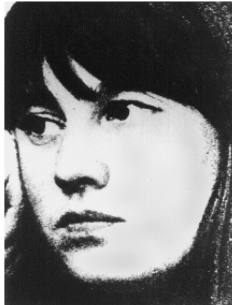
Ulrike Meinhof als Studentin