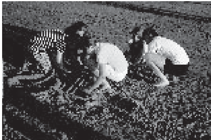
Am Nordseestrand angekommen; Achtkläßlerinnen »bauen« ein Tandem

Während man bei früheren Fahrten in Jugendherbergen übernachtete, war jetzt Zelten und Selbstversorgung angesagt. Eine Nacht schliefen wir in Klassenräumen der Hammer Waldorfschule. Um halb acht mußten die Räume wieder für den Unterricht hergerichtet sein. 300 Mark durfte die 12tägige Tour kosten. Dank der Reisetüchtigkeit, die die Kinder in früheren Jahren erworben hatten, wurden auch diese neuen Herausforderungen gemeistert.