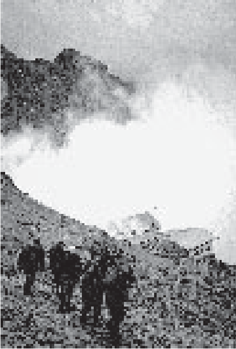
Auf der Zugspitze