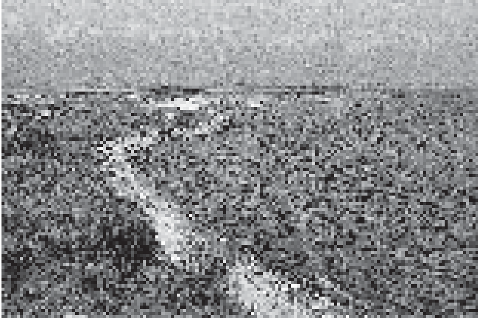
Abb. 4: Steppe an der rumänischen Schwarzmeerküste südlich des Donaudeltas. Spätherbstlicher Aspekt