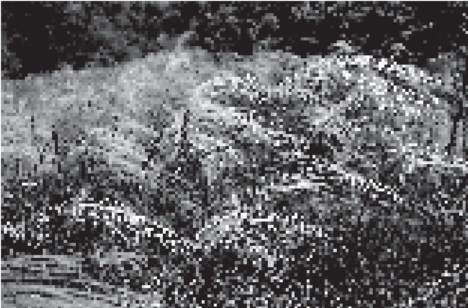
Abb. 5: Federgras-Steppe