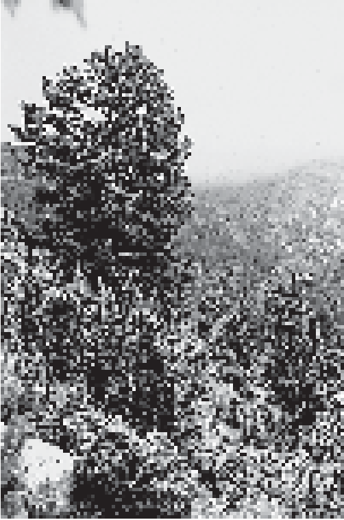
Abb. 2: Arve (Zirbelkiefer), Lärchen und Fichten nahe der Baumgrenze in den südlichen Karpaten (Retezat-Schutzgebiet).