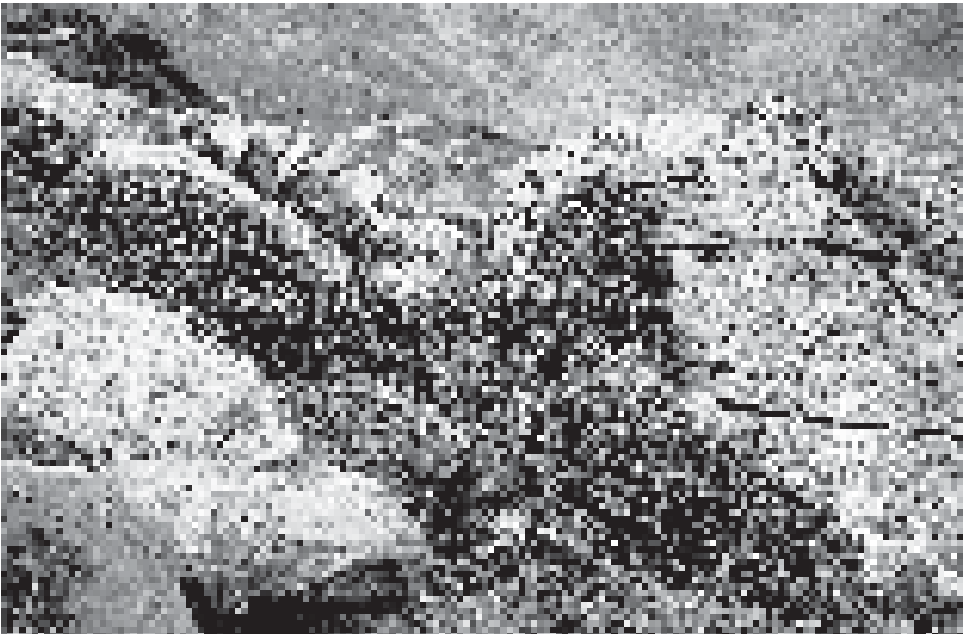
Abb. 3: Alpenrosen im Bereich der alpinen Matten oberhalb der Baumgrenze (Retezat-Schutzgebiet, Südkarpaten)