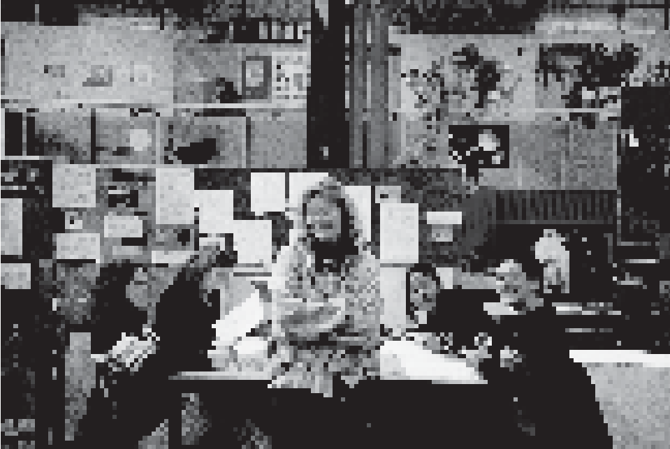
In Haus 2 (für 3. bis 10. Schuljahr), Gruppenarbeit 8. Klasse

soziales Wesen, insbesondere gegenüber Kindern anderer Hautfarbe, ist gelebtes Motto. Gastkinder aus den entferntesten Regionen der Erde, die manchmal im Gefolge ihrer Eltern, die an der Uni arbeiteten, nur für begrenzte Zeit auf der Schule waren, wurden ebenso wie Migrantenkinder begeistert aufgenommen, war von ihnen doch so viel Spannendes zu erfahren. Ausländerfeindlichkeit habe ich persönlich in den 13 Jahren an dieser Schule nicht erlebt.