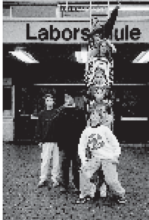
Diese Schüler machten während einer Projektwoche als Team eine Zeitung

Hentig gehört zu den »großen Pädagogen unserer Zeit, die die Fähigkeit besitzen, in einem weiten Bogen von der antiken Welt bis heute Strukturen des Denkens sichtbar zu machen« (Oskar Negt). Man könnte Hentig, der auf die Kraft der Ideen und des lebendigen Denkens vertraut, einen modernen Platoniker nennen. »Wir müssen Menschen zum Aushalten von Offenheit und von Ambivalenz, von Zweiwertigkeit erziehen und nicht den kleinen Menschlein immer schon sagen, es läuft alles nach dieser Regel: Der Ablativ folgt immer wenn ... Ihnen nicht einprägen, daß die Welt geordnet ist wie ein Rechenschieber. Sie darauf vorbereiten, daß das, was man ihnen jetzt gibt, Mittel sind für unterschiedliche Lagen: Alles kann ganz anders sein, und du bist vor allem immer wieder anders als ich. Deine Lösung könnte besser sein, probier mal aus!« (»Bildung«, 1996). Bildung ist nach Hentig die Kunst, sich immer wieder zu erfinden, sie ist eine Leistung des Individuums, das es versteht, seine Schwäche, seinen Mangel in Stärke zu verwandeln. Diese Entwicklungsbedürftigkeit des Menschen in einer liebevollen, fehlertoleranten und erfahrungsorientierten Lernatmosphäre ist Hentigs Credo. 1988 ließ sich Hentig vorzeitig emeritieren, um die Zeit stärker zum Schreiben zu nutzen. Seine umfangreichen Publikationen reichen von der antiken Bildung über die Auseinandersetzung mit Ivan Illichs Ideen bis zur aktuellen Bildungssituation unserer Zeit. Hier seien nur seine letzten Bücher erwähnt: Das Buch