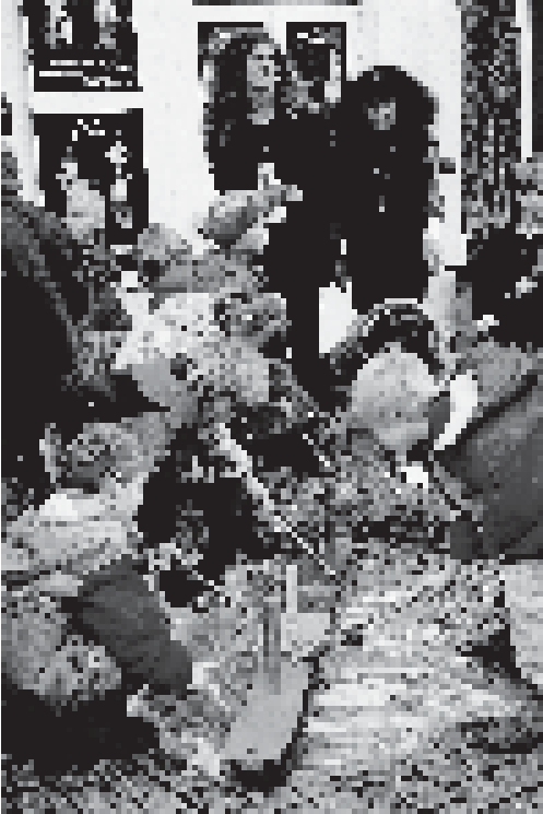
Projekt »Kindheitsmuseum«: 5-7jährige, von Klee angeregt, basteln Vögel und Bretter für sie

vor Jahren gesagt, die Laborschule sei zwar als Vorbild gelobt worden, habe aber trotz aller nachweisbaren Erfolge die Regelschule nicht verändern können und sei deshalb mit ihrem eigentlichen Anliegen gescheitert. Veränderungen im Bildungswesen benötigen lange Zeitspannen. Nach der Bildungseuphorie der 70er Jahre und der nachfolgenden Stagnation kann man heute sagen, daß auch in den