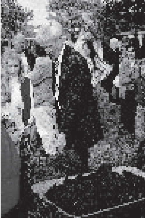
Hartmut von Hentig bekam zum 70. Geburtstag von der Laborschule und dem Oberstufenkolleg Apfelbäume geschenkt

Sensibilität im Umgang mit uns, war es, was Nähe und Vertrautheit erzeugte. Hildegard Hamm-Brücher nannte ihn einmal »überzart und hochsensibel« und bewunderte ihn, der in den politischen Auseinandersetzungen um die Bildungsreform der Entschiedenste war und so »standhaft auf seiner Position zwischen den Stühlen bestand«.