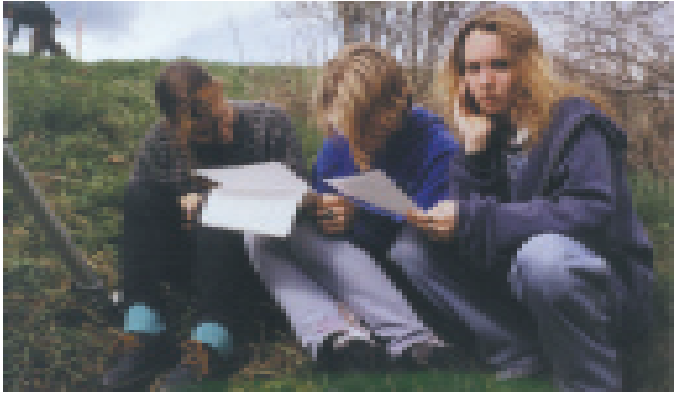
Feldmessen in Tschechien

puterexperten enthalten, der den anderen Teilnehmern bei der Erledigung der Untergruppenaufgabe eine Hilfe wäre.