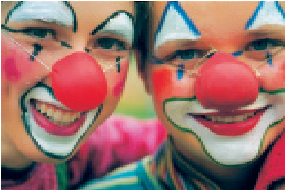
Schnappschuss bei der Probe