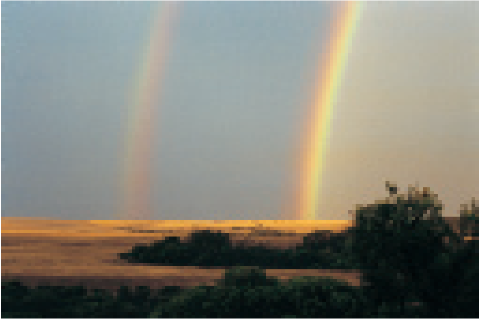
Regenbogen, Symbol von Wargyl, der Regenbogenschlange, die die Welt erschuf