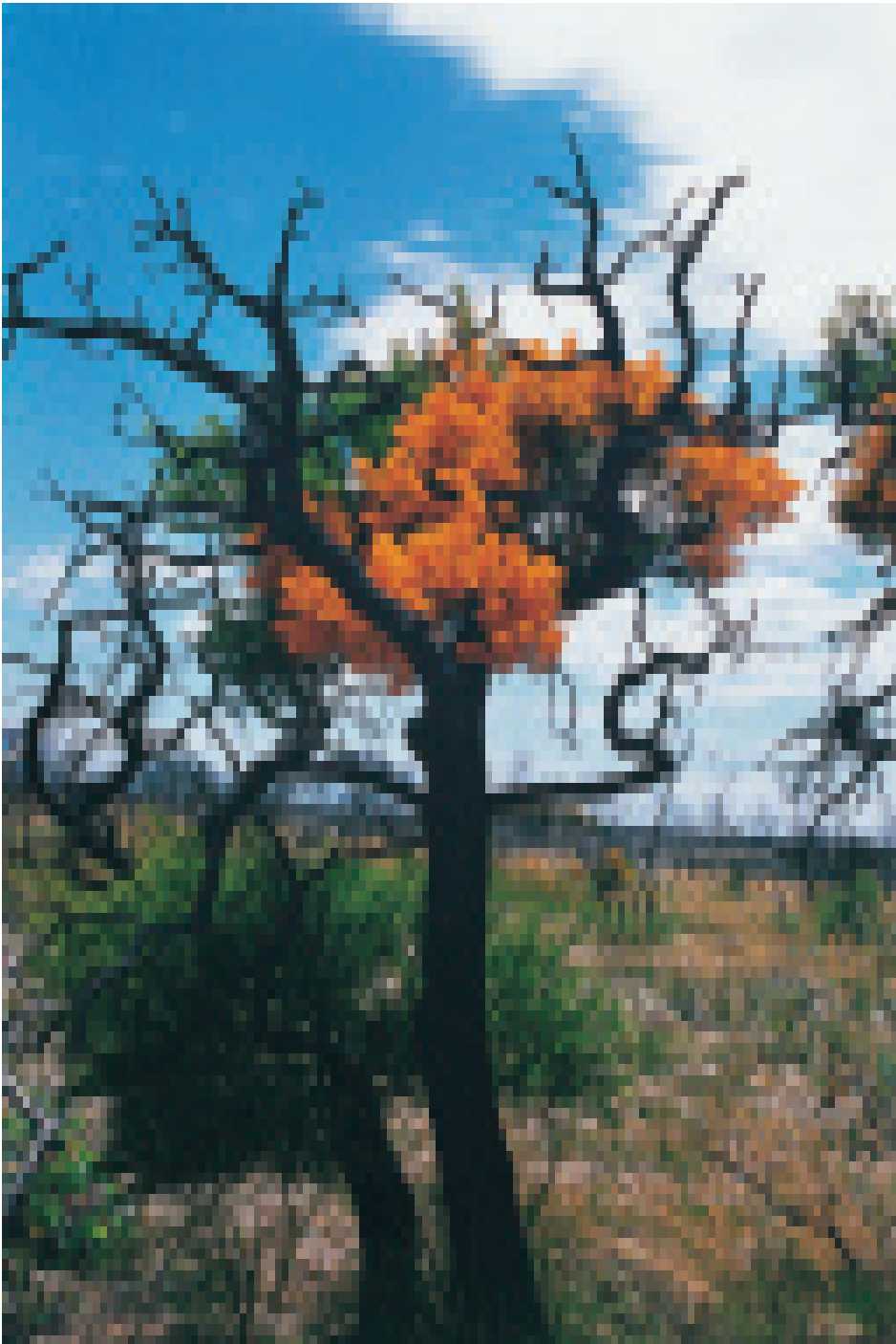
Moodjah ist der Weihnachtsbaum bei den Aborigines. In seinen Zweigen ruhen die Verstorbenen, bevor sie ihre Reise in die Geisterländer fortsetzen.