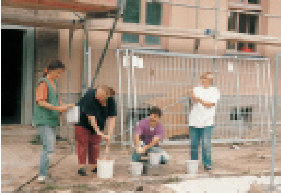
Helpende Hände vor dem Umzug der Freien Waldorfschule Greifswald ins neue Schulgebäude

Kindertagesstätte angeboten worden, die sich letztlich in der Bausubstanz und der Lage als ungeeignet erwies. Es folgten zahlreiche Gespräche mit den verantwortlichen Persönlichkeiten der Stadt, die eine Ansiedlung der Waldorfschule in Greifswald begrüßten. Die Bürgerschaft fasste schließlich den Beschluss, das Vorhaben zu unterstützen. Im weiteren Verlauf bot die Stadt kostengünstige Grundstücke aus städtischem Besitz an. Die Gesamtschätzungskosten für einen Neubau beliefen sich einschließlich Grundstückskauf auf 14-15 Millionen Mark. Im Januar 1999 wurde dem Schulträgerverein eine in den 30er Jahren gebaute ehemalige Kaserne, die seit den 50er Jahren als Wohnhaus diente, zum Kauf angeboten. Das Gebäude ist groß genug, um einer Schule mit Kindergarten und Hort Platz zu bieten. Der Standort, auf einem etwa 10.000 Quadratmeter großen Grundstück, ist über den in der Nähe befindlichen Südbahnhof und die Busanbindungen aus allen Richtun-