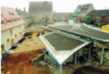
Das umgebaute Schulgelände in Halle

mit Missverständnissen. So wie im Vorfeld der Gründung gab es Spannungen und schmerzhaft Trennungen, die es zu ertragen galt um der Sache willen, der Arbeit mit den Kindern.