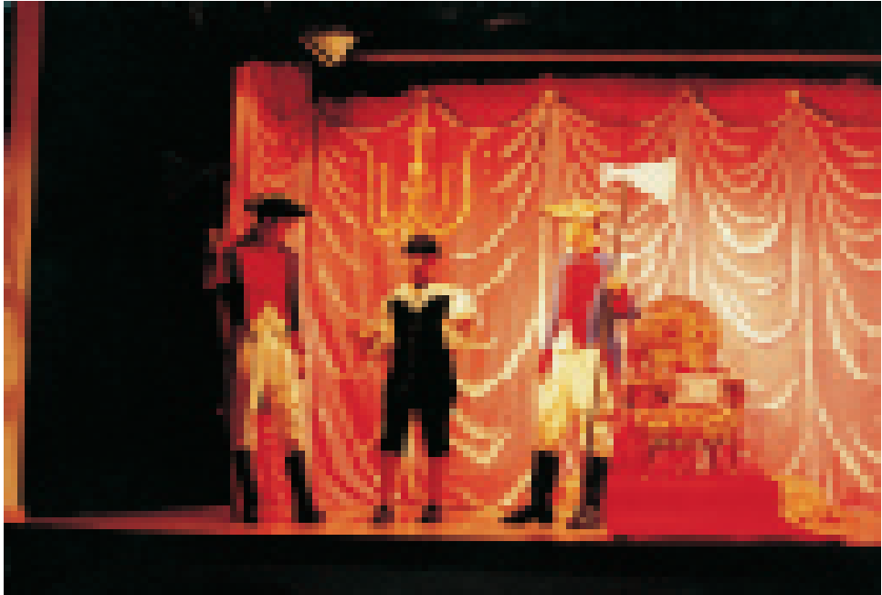
Aufführung des Klassenspiels »Des Königs Schatten« an der Freien Waldorfschule Greifswald

Kontakte über die Grenze nach Slubice, der auf der polnischen Seite der Oder gelegenen ehemaligen Dammvorstadt Frankfurts. Drei polnische Erstklässler konnten wir so gewinnen. Bereits seit Jahren besuchen einzelne Schüler aus dem Nachbarland unsere Schule. Unsere Versuche, Polnisch als zusätzliche Sprache im Fächerkanon zu verankern, sind bisher noch nicht geglückt, doch sehen wir in der Verbindung zu Polen einen wesentlichen Akzent für die zukünftige Entwicklung unserer Schule.