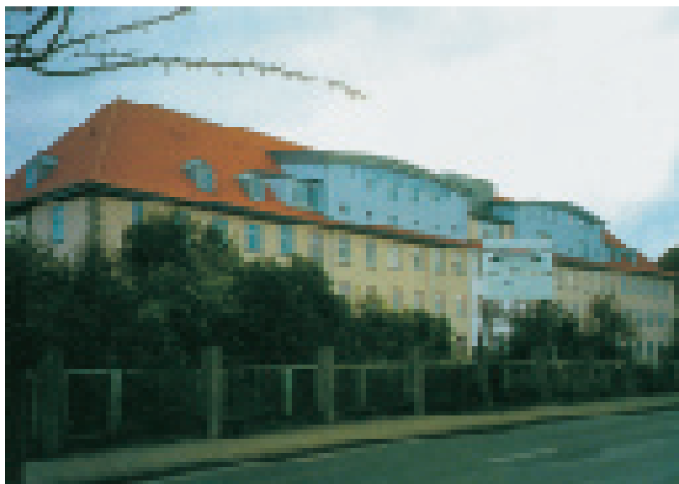
August 2000: Die umgebaute Kaserne in Greifswald

Daches konnte der gesamte Charakter des ehemaligen Kasernengebäudes verändert werden. Ende Februar waren die umfangreichen Abrissarbeiten beendet. Die Zeit bis zum angestrebten Einzug war denkbar knapp. Das Dach, der Außenputz, alle 120 Fenster sowie der vollständige Innenausbau für den ersten Bauabschnitt von rund 3000 Quadratmeter mussten bis zum Sommer fertig werden. Ende Mai feierte die Schulgemeinschaft das Richtfest, Mitte August konnte mit dem Lasieren der Wände, dem Bau der Tafeln und den ersten Reinigungsarbeiten begonnen werden. Eltern, Schüler und Lehrer bevölkerten neben vielen Bauarbeitern das neue Schulhaus, und wenige Tage vor Schulbeginn gelang der Umzug mit dem gesamten Mobiliar der Schule und des Kindergartens. Über einhundert Helfer bewältigten diese Aufgabe an nur einem Tag. Pünktlich am 31. August öffnete sich das wunderschöne lichte Schulhaus, und die Schüler nahmen es staunend in Besitz.