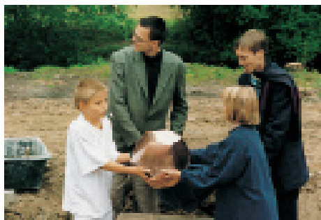
Freie Waldorfschule Weimar. Grundsteinlegung des Schulneubaus 1997

Das Orchester beint im Moment nicht so richtig. Es klang aber gut, zusammen mit zwei Partnerorchestern, als der Orchesterleiter noch da war, einige Höhepunkte einiger Jahre! Der Musiklehrer fehlt! Das Orchester wartet.