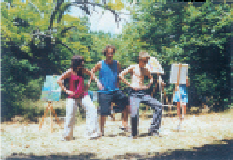
Dresdner Waldorfschüler (siehe S. 1340)

wusstsein eine Aversion gegen solche gemeinsamen Großprojekte hat. Hier müssen andere, eigene, vielleicht ganz neue Wege gefunden werden.