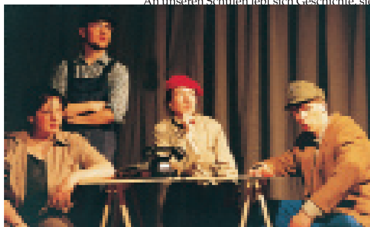
»Das Spiel ist aus«. Klassenspiel der 12. Klasse der Freien Waldorfschule Weimar im Herbst 2000

An unseren Schulen lebt sich Geschichte. Mein ganzer Staat wurde umgekrempelt. Aus Bezirk Erfurt wird Freistaat Thüringen. Am Anfang ist noch Luft für freie Schulen, doch dann: Die Finanzen werden gekürzt, die Inhaltsverwaltung tät gern zugreifen ... An unseren Schulen lebt sich Geschichte, sie