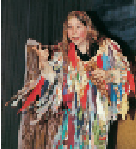
Papageno aus der Zauberflöte, aufgeführt zum zehnjährigen Jubiläum der Leipziger Waldorfschule (siehe S. 1353)