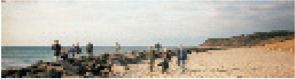
Klassenfahrt mit Viertklässlern von der Freien Waldorfschule Schwerin auf die Insel Hiddensee

Waldorfschulen. Da muss einfach eine Betreuung und ein warmes Essen organisiert sein, sonst sind die Schulen nicht möglich.« Nachdem einige Waldorfkindergärten im Umfeld der Schulen nicht mehr genügend Kinder fanden, aber viele Anfragen für kleinere Kinder vorlagen, haben manche auf die neue Nachfrage reagiert – und es werden jetzt Kleinkindergruppen für Kinder ab etwa einem Jahr angeboten.