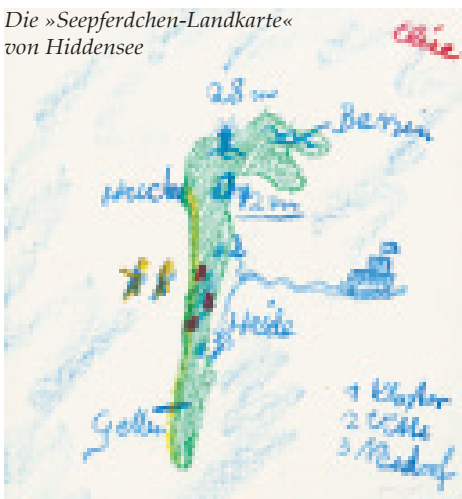
Die »Seepferdchen-Landkarte« von Hiddensee

Zugegeben, etwas merkwürdig ist es schon: