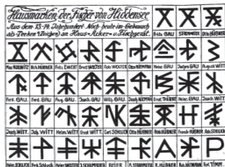
Die Hausmarken der Fischer von Hiddensee mit ihren Runen

Jeden Abend vor dem Zubettgehen lauschten wir dem, was der Inselpastor über diesen merkwürdigen Menschenschlag auf der Insel schrieb. Und als wir hörten, dass bis ins heutige Jahrhundert hinein nur freitags geheiratet wird, weil dies der Tag der Fruchtbarkeitsgöttin Freyja ist, ahnten wir das noch tiefe Verwurzelte sein dieses eigenbrötlerischen Menschentyps mit dem alten