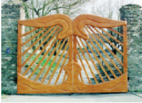
Schuleingang der Freien Waldorfschule Halle

Ort des gemeinschaftlichen Lebens sollte entstehen, eine Lern- und Begegnungsstätte für viele Schülergenerationen – ein »bunter Farbtupfer in unserer Bildungslandschaft«. Viele Gespräche waren notwendig, um zwischen Träumerei und pragmatisch zweckgebundener Idee die optimale Nutzung der vorhandenen Gebäudesubstanz zu erzielen. Vieler Kämpfe und erzwungener Geduld – bis an die Zerreißprobe – bedurfte es bis zum heutigen Stand des Schulhauses in Beesen.