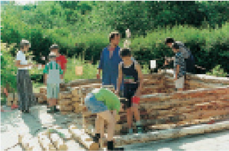
Freie Waldorfschule Frankfurt-Oder: Hausbau-Epoche in der 3. Klasse (oben), Biologieunterricht im Freien (unten; siehe Seite 1342 ff.)