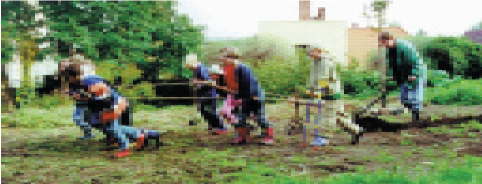
Ackerbau-Epoche (3. Klasse) in Halle

ginnt der Ausbau des alten Speichers zu einem Hortgebäude mit Küche, Speisesaal und Räumen für Arbeitsgemeinschaften. Ein neues Projekt, vom Waldorfkindergarten initiiert, wartet mit viel Arbeit auf helfende und finanzierende Hände.