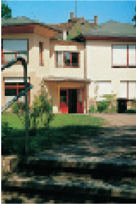
Schulneubau der Freien Waldorfschule Dresden

gend und könnte die sich langsam entwickelnden Hüllen, ob nun Schulneubau, Altbausubstanz oder DDR-Plattenbau, mit wirklichem Inhalt füllen.