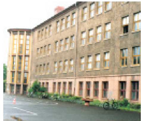
Freie Waldorfschule Leipzig (siehe S. 1353)

Immer muss mal gebaut werden. Auch in Weimar. Zum Glück gab es am Ende unseres kleinen Gässchens, am Ende des Klos-terweges einige Ruinen. Die und die dazugehörigen Grundstücke konnten wir günstig erwerben. So brauchte man nicht ganz auf die »grüne Wiese« auszuweichen.