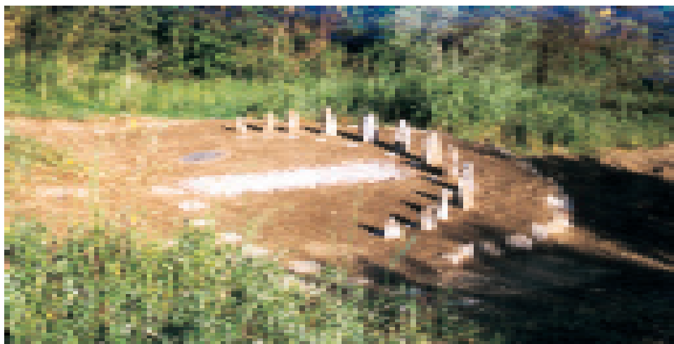
Die fertiggestellte Sonnenuhr

Sobald es danach in Gruppen auseinanderging, wandte sich eine Gruppe der Malerei zu, während eine andere damit beschäftigt war, verwilderte Abschnitte des Grundstücks zu roden und neue Bäume zu pflanzen. Eine weitere Gruppe baute eine Sonnenuhr, eine