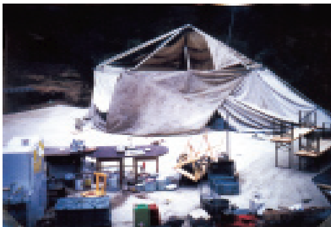
Das verwüstete Zelt nach dem Unwetter

Nachdem wir Lalunda ein klein wenig als unser Zuhause empfinden konnten, konnte das geplante Unterrichtsprojekt starten. Die allmorgendliche Eurythmie gehörte zum Tagesbeginn wie das Aufstehen und das gemeinsame Frühstück. Der Hauptunterricht führte die Schüler einerseits in die Welt des Mineralischen (Gesteinskunde) und andererseits hinaus in die Weite der Gestirne (Himmelskunde), die im Projekt miteinander verknüpfen und Steinbruch konnten wir eine Vielzahl von kristallinen und amorphen Gesteinen entdecken; in einer aufgerissenen Bergflanke fanden wir eine Ader mit Eisenerz; das unverfestigte Gestein einer etliche Meter senkrecht aufragenden Lösswand wurde staunend untersucht. Durch eine herrlich warme Schwefelquelle lernten wir weitere Geheimnisse des Erdinnern kennen. Des Nachts fanden wir dann das Gefunkel der Kristalle wieder im Funkeln der Sterne draußen am Firmament und erkannten die Ordnung, in der sich die Sterne im Tierkreis finden. Der sich an den Hauptunterricht anschlie-