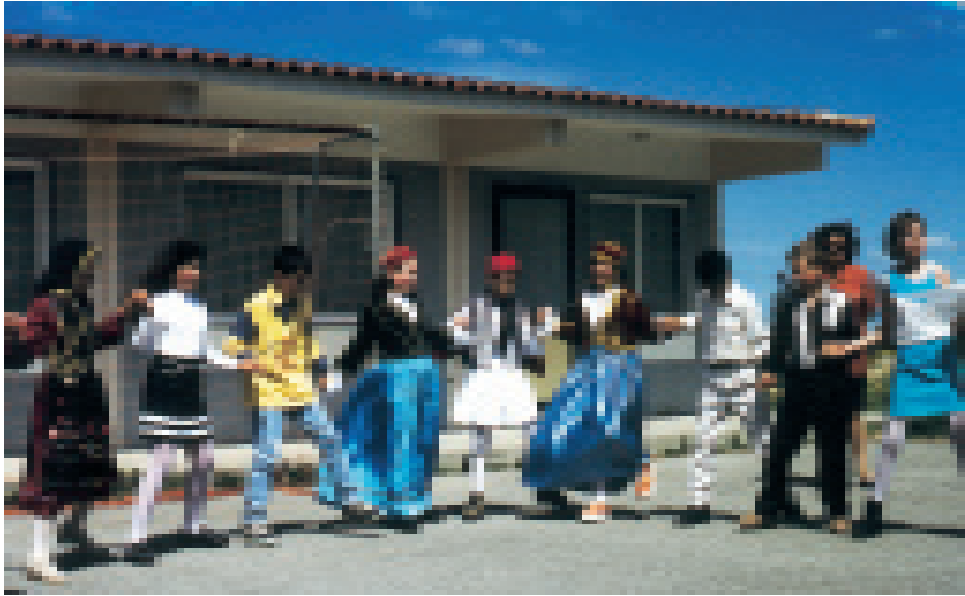
Schulkinder aus dem benachbarten Dorf zeigen einen Volkstanz.

Aufgabe, die allen besonders am Herzen lag: Es sollte eine begehbare Sonnenuhr werden, in der der betrachtende Mensch selbst Schatzenzeiger ist.