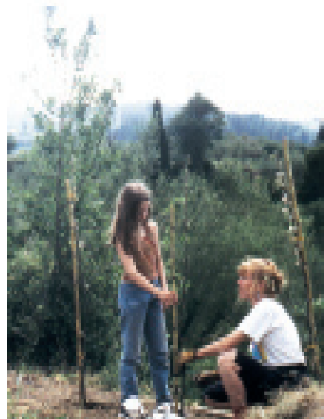
Mit Sorgfalt werden junge Bäume gepflanzt

kein Zeltdach. Dies sollte ebenso wenig unser größtes Problem sein wie die in Deutschland vergessenen Staffeleien.