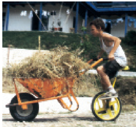
Ein Schüler transportiert Mulchmaterial

Nach einem phasenweise nicht immer leichten Prozess in der Elternschaft ergaben sich dann all die Dinge, die zu einem guten Gelingen notwendig waren: Da war eine im Aufbau befindliche kleine Ferienanlage auf jenem Anwesen auf der Peloponnes, es gab das Angebot eines Reisebusses zu überaus günstigen Konditionen, in der Elternschaft fanden sich ein Busfahrer, eine Mutter, die vor etlichen Jahren als Reiseleiterin in Griechenland tätig war, eine Malerin für den Malunterricht, eine Landschaftsgärtnerin und ein im Landschaftsgartenbau erfahrener Vater für die Kultivierung verwilderter Bereiche sowie ein Vater, der uns eine Köchin vermitteln konnte, die die Peloponnes kennenlernen wollte und uns dafür bekochte. Daneben waren da noch die Eu-rythmistin und der Gärtner vor Ort, der für die Kinder ein beliebter Lehrer des regelmäßigen Griechisch-Unterrichts war, und vor allem unser Mann für alle Fälle, für den es kein Problem gab, für das er nicht irgendeine Lösung gefunden hätte.