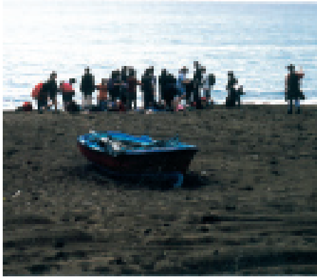
Die Wanderung zum Meer – das Ziel ist erreicht

Da sieben Schüler aus unterschiedlichen Gründen an dem Projekt nicht teilnehmen konnten und deshalb eine separate Unterrichtslösung gefunden werden musste, waren es schließlich siebenunddreißig Schüler einschließlich dreier Gäste, die gleich nach den Osterferien mit ihren Begleitern zu einer nicht enden wollenden Busfahrt nach Bari starteten, wo die Fähre auf uns wartete. Knapp drei Tage dauerte die Reise, bis wir Krestena an der Westküste der Peloponnes zwölf Kilometer südlich von Olympia erreichten.