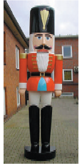
Nussknacker in Übergröße