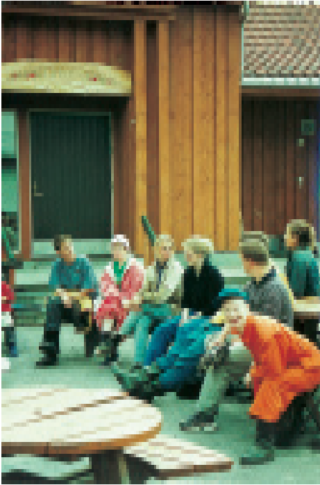
Vor dem Gemeinschaftshaus »Iduna«