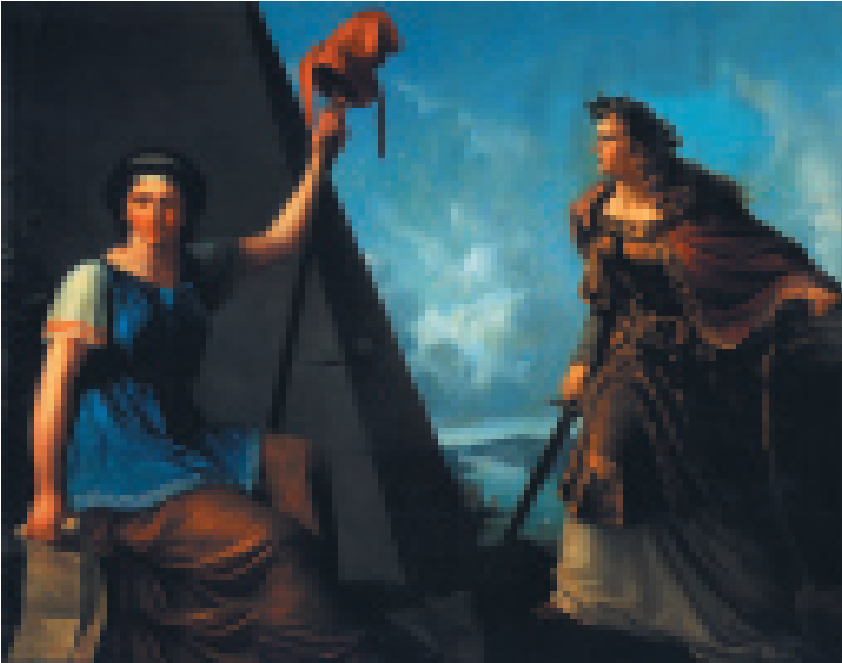
»Marianne (links) und Germania (rechts)«: 1789-1889: »Frankreich und Deutschland – zwei Welten.« Photomontage zum Ausstellungskatalog zu den Berliner Festspielen 1997

Zunächst der berühmte Aufruf im Radio London: Appel du général depuis Londres à la résistance contre l’occupant allemand (discours diffusé par la BBC) – 22 juin 1940: