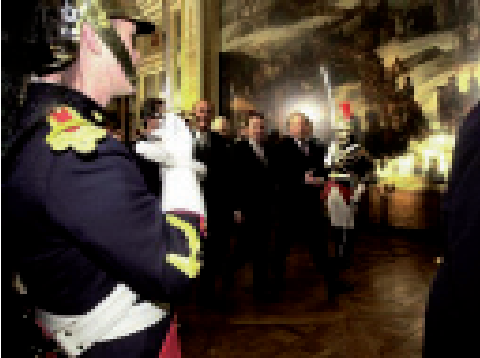
Auf dem Weg zur gemeinsamen Sitzung der deutschen mit den französischen Parlamentariern in Versailles