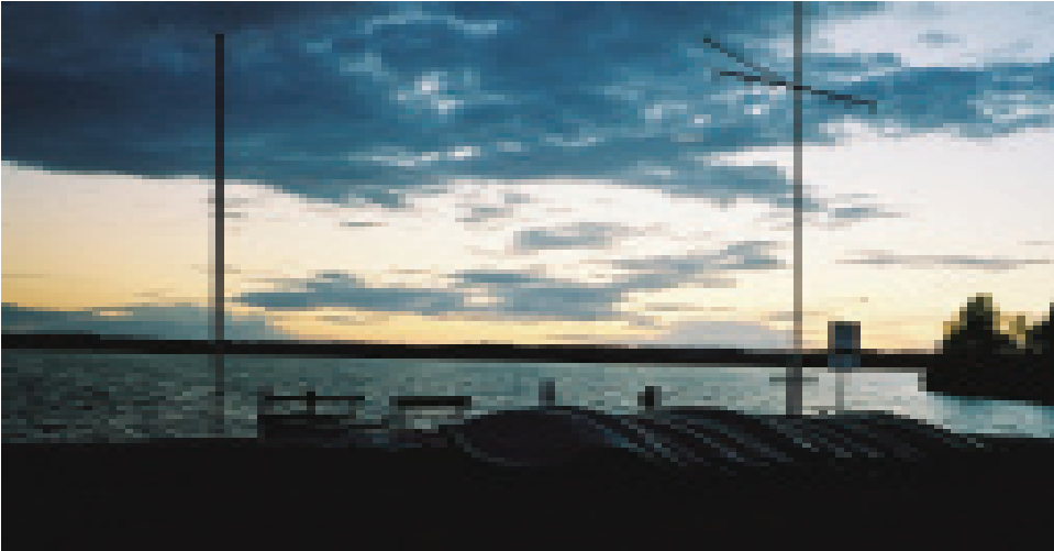
Abendstimmung in Neustrelitz

Regel auch mit schwierigen Situationen deutlich gelassener um. Es gab kaum Gejammer über den Regen. Im Gegenteil, die Schüler lenkten selbst bei stundenlanger Fahrt im Regen ihre Aufmerksamkeit immer wieder auf Besonderheiten: Das Geräusch, welches die Regentropfen beim Auftreffen auf der Wasseroberfläche erzeugen, das Licht der Sonne, welches die von den Bäumen herunter fallenden Tropfen in »flüssige Diamanten« verwandelt, das Verhalten der Wasservögel, der doppelte Regenbogen.