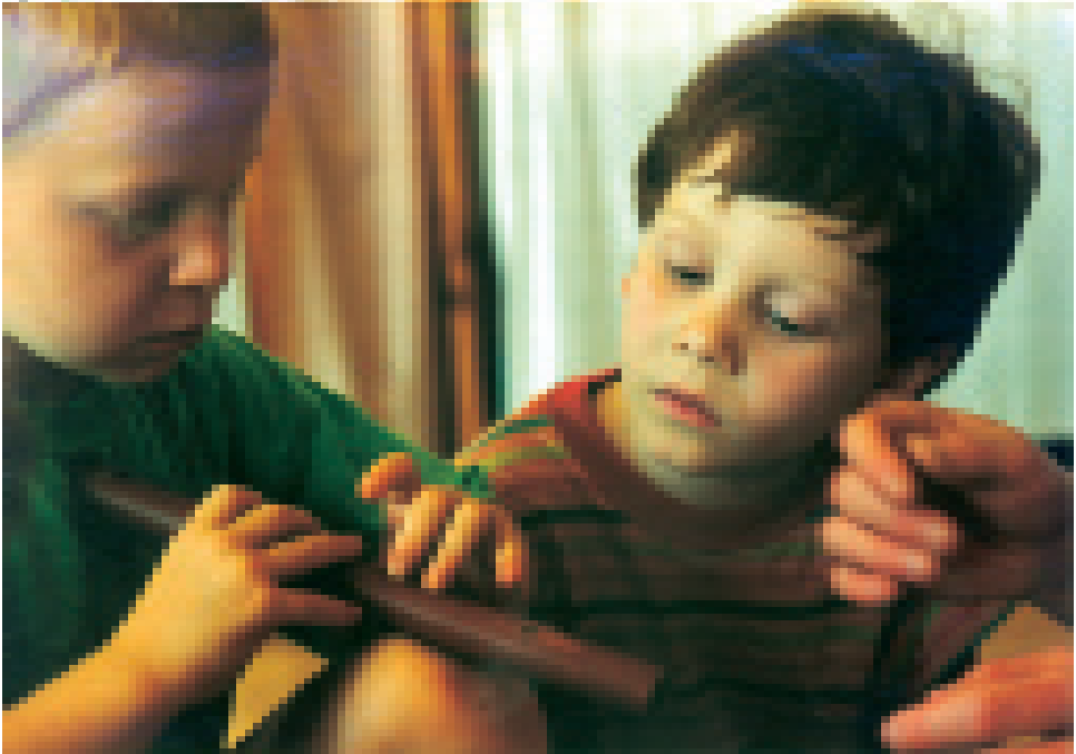
Für potenzielle Bläser ist der Flötenunterricht die angemessene Basis

Lernen vieler klassischer Schulfächer hilfreich entgegenkommen. 1