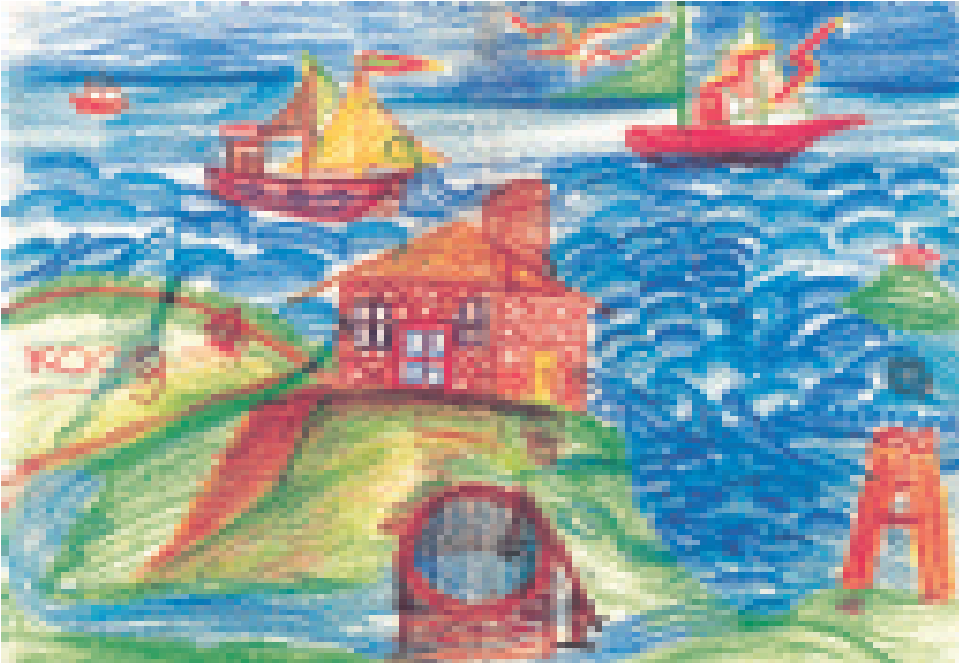
Farbenfroh und vielfältig gestaltet der Sanguiniker sein Bild

erst meine Lieblingsfarben: Dunkelgrün und Dunkelblau. Am unteren Bildrand fange ich an, das ist wohl das Beste. Die erste Welle sehr sorgfältig in die Ecke zeichnen ... mit schrägen Kanten und einer Spitze obendrauf... wie ein Dreieck sieht es aus ... nun die nächsten Wellen daneben und darüber: die sollen ganz ähnlich aussehen ... durch meine Spitzen sehen die Wellen wie vom Sturm gepeitscht aus.« (Dass sie uns Betrachtern wie Berge erscheinen, wurde nicht bemerkt. Die tiefe Beziehung dieses Temperamentes zum Erd-Element mit seinen kristallinen Formen spiegelt sich hier auf eine interessante Weise wider.) »So, nun male ich mein Haus, in dem ich am liebsten einmal wohnen möchte ... ganz einsam ... aber mit meinen lieben Eltern und Geschwistern zusammen ... hoch über dem »tobenden« Wasser ... ein großes, breites ... das Fachwerk und die Fenster muss ich ganz genau zeichnen, damit das Haus im Sturm nicht umfällt ... mein Haus bekommt drei Schornsteine, damit es überall warm ist ... nun kann ich mich darin ganz sicher und wohl fühlen. – Aber alles sieht in meinem Bild so ruhig aus ... ich sollte auch eine gefährliche, springende Welle malen ... hier, rechts oben, kommt sie hin (wie eine Locke aussehend) ... nicht zu nah am Haus, denn dem darf kein Leid geschehen und außerdem sind ja Menschen und Tiere drin ... Nun noch den grauen Himmel, und die Sonne soll ein wenig durchscheinen ... auch wenn es stürmt.«