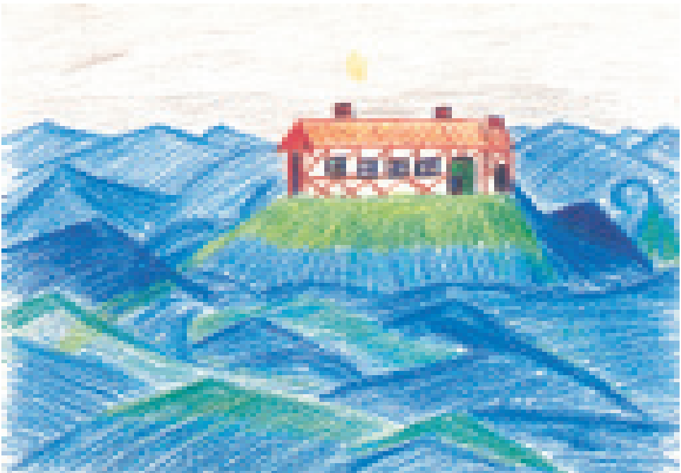
Durchdacht und systematisch gestaltet ist das Bild des Melancholikers

In aller Ruhe. »In der Mitte des Blattes anfangen, ganz links. Zuerst eine kleine Hallig, grün und schlicht. Rot das Haus, die Fenster weiß aussparen, dann leuchten sie ... so ist es auch am einfachsten. Nun weiter nach rechts. Insel und Haus werden größer ... und wieder weiter ... grün die Insel, rot das Haus ... und so geht es weiter ... eine ganze Reihe ... von Klein nach Groß ... alles ist friedlich, alles ist ruhig ... (Welch' schöne Farben! Es sind die Komplementärfarben Rot/Grün) ... nun das Meer darunter malen ... eine schöne runde Welle ... noch eine Welle ... Welle für Welle. Nun die nächste Reihe: Welle ... Welle ... Reihe für Reihe ... alles wird ausgefüllt ... bis zum unteren Bildrand. Nun noch das Meer im Hintergrund malen. Die Abendsonne, sie spiegelt sich. Der Abendhimmel ... fertig ... Halt, zum Abschluss gehört auf die Rückseite des Bildes das Thema ... Wie hieß es noch? ... Ach jetzt hab' ich es!« Er schreibt: »Sturmflut« und darunter seinen Namen.