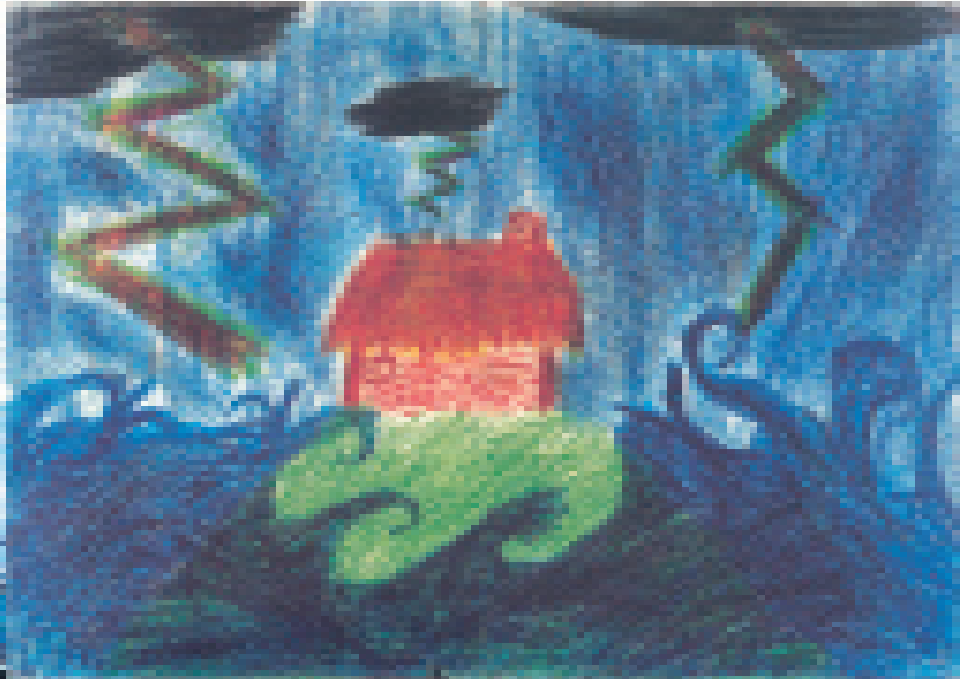
Machtvoll und dynamisch erlebt der Choleriker die Sturmflut