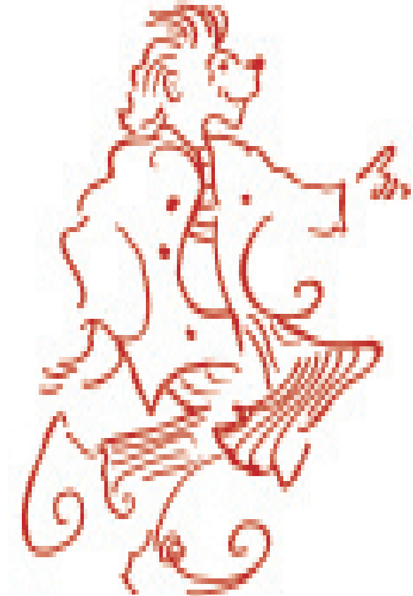
Nicks, der Sanguiniker. Zeichnung von Frieder Nögge