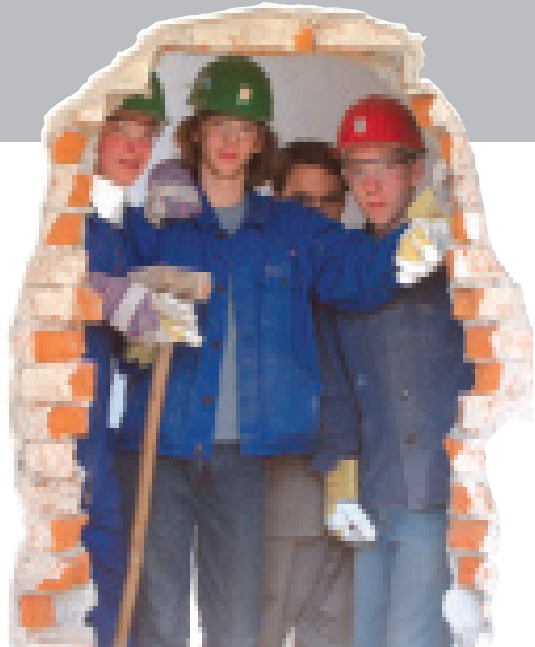
Die neue Tür im Kindergarten entsteht

• Den Schülern stehen in diesem Alter (14-16 Jahre) schon weit entwickelte kognitive Fähigkeiten zu Verfügung. Sie schaffen es aber oft nicht, vom Gedanken zu Willensentschlüssen und zum Tun zu kommen. Dieses Phänomen ist altersgemäß, es droht aber heute immer stärker die Gefahr, dass Jugendliche auch in den folgenden Klassen,