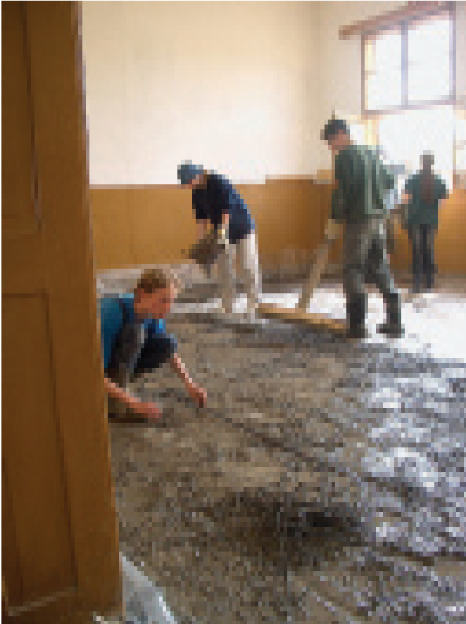
Der neue Fußboden entsteht

Hilfsprojekten in der Dritten Welt erfahren haben, half sehr. Aber noch in der Woche vor der Abreise fragten einige Schüler, ob wir die Reise nicht absagen oder wenigstens verkürzen könnten.