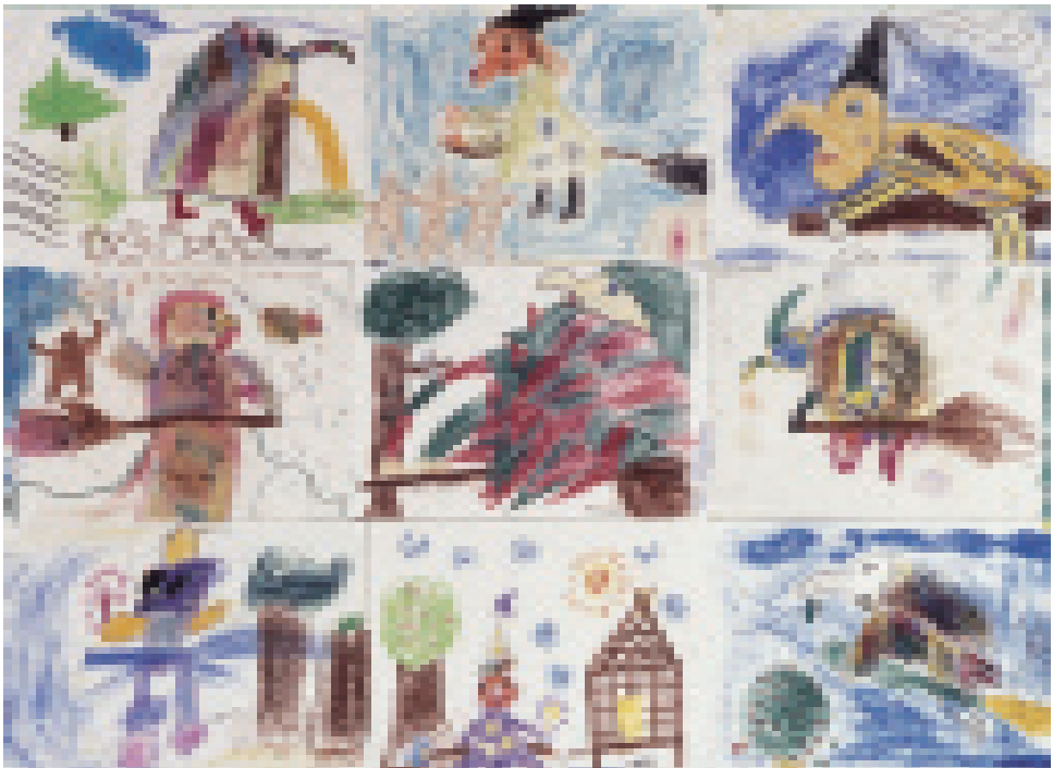
Die »Hexe aus dem Weihnachtsmärchen« wird zum Ratespiel

Gemeint ist also ein Spielen sowohl im Sinne von play als auch Fairplay. Dies ist übrigens auch in allen schöpferischen bzw. schöpferisch gestalteten Schulfächern möglich. Hierfür ein Beispiel: