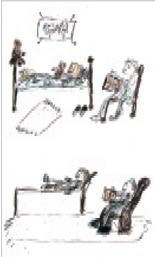
Zweimal Zuhören bei der Gutenacht-Geschichte: Wo kommt sie besser an?