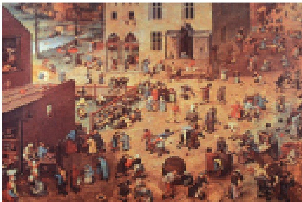
Pieter Breughel: Kinderspiele (1560) – leibhaftige Welterfahrung

Und wie werden die Seligkeiten entdeckt? Spielend! Gemeint ist von Astrid Lindgren