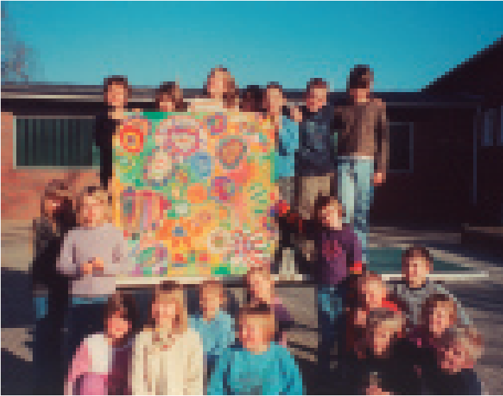
Gemeinschafts- produktion: Jedes Kind hat seine Blume gemalt