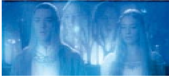
Abb. 4: Elben statt Affen – Tolkiens Gegenwelt zu Darwin (aus Peter Jacksons Film »Der Herr der Ringe – Die Gefährten«)

Im Gegensatz zur Science-Fiction-Literatur, die in die Zukunft blickt, geht der Blick der Fantasy-Literatur in die Vergangenheit, in eine frühere Welt, in ein »Goldenes Zeitalter« zurück, in dem noch alles in Ordnung war. 7 In der Welt der Hobbits gibt es noch keine Fabriken und Maschinen. All das wird dem Reich des Bösen zugeschrieben, in dem die Widersacher ihre brachialen Kriegsgeräte schmieden und entseelte Soldatenbestien züchten. Das Gute dagegen, die Welt der Hobbits und des »Auenlandes«, die Welt der Elben, der Vorfahren der Menschen, trägt in weiten Zügen den Charakter des vorindustriellen Zeitalters. Diese, wenn man so will, »ökologische« Botschaft Tolkiens war es auch, die den »Herrn der Ringe« in der Zeit des Aufbruchs der ökologischen Bewegung im Amerika der 60er Jahre zu einem Kultbuch werden ließ.