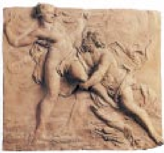
Raub der Persephone. Musée des Beaux Arts, Brüssel

die Erzählung, den Inhalt, der mehr oder weniger auch Erklärung ist für das, was sich im Jahreslauf abspielt und die Lebensgrundlage der Menschen bildet. Darin kommen aber (zweitens) auch bestimmte Zeitpunkte von Ernte, von Aussaat und so weiter zum Ausdruck, also etwas, was wir heute als Agrarwissenschaft bezeichnen würden. Denn Wissenschaft im heutigen Sinne gab es noch nicht. Dieser Inhalt wurde drittens in Form eines Dramas künstlerisch dargestellt. Diese drei Komponenten, die wir heute losgelöst voneinander als Wissenschaft, Kunst und Religion haben, bildeten den Mythos.