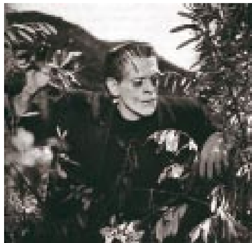
Boris Karloff als Frankensteins Monster in dem gleichnamigen Film von 1931

Parallel zu Goethes »Faust« und im unmittelbaren Umfeld von Erasmus Darwin entsteht in der Auseinandersetzung mit der Frage nach dem Menschenbild nun eine ganz neue Form der Literatur, die so genannte Science-Fiction-Literatur. Der erste Science-Fiction-Roman, der mit den darwinistischen Anschauungen über den Menschen tatsächlich umgeht, ist Frankenstein (1818) von Mary Shelley (1797-1851), deren Vater William Godwin (1756-1836) noch mit Erasmus Darwin bekannt war und der aus dem Kreis der englischen Romantik stammte. Mary Shelley beschreibt die Erschaffung eines künstlichen Menschen und ist bemüht, mit den wissenschaftlichen Anschauungen ihrer Zeit in