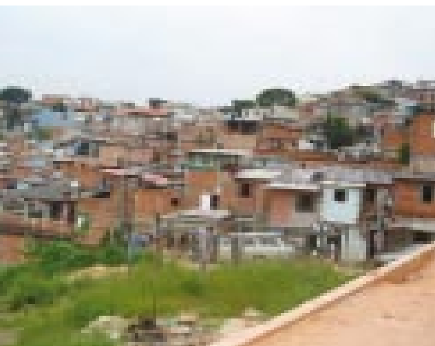
Die Favela Jardim Boa Vista

besonders gute Gesundheitspflege bzw. finanzielle Möglichkeiten für einen Arztbesuch, geschweige denn einen Arzt oder Therapeuten, gibt.